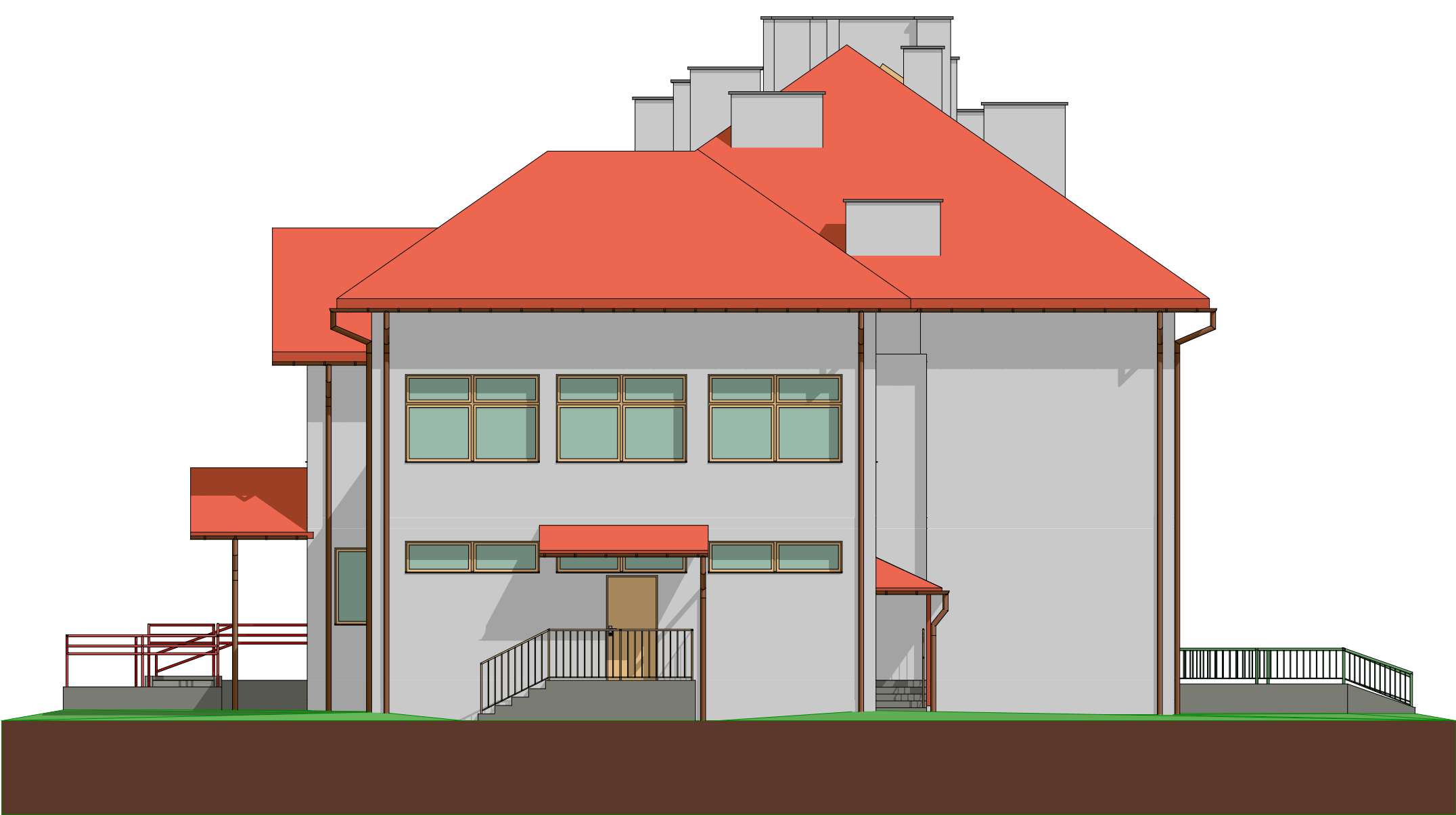
Elewacja Południowo-Zachodnia skala 1:100